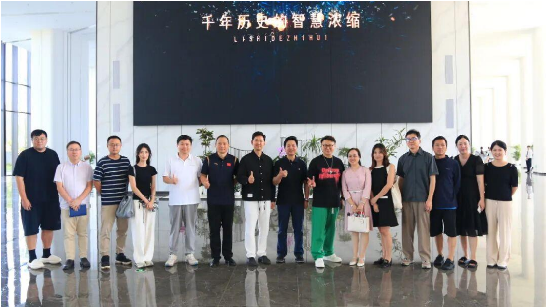
武汉东湖学院与湖北广电教育频道深化合作，共绘协同育人新蓝图

以高效执行力制定详细计划，明确近期目标，把协同育人落到实处；抓住人才培养方案制定、科研课题申报等方面的小切口，共同培养适应时代和社会需求的应用型媒体人才，为学生提供更多实践机会。