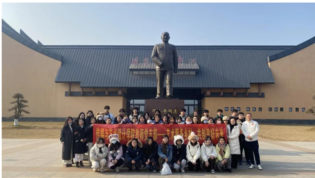
武汉东湖学院传媒与艺术设计学院师生集体学习红色文化