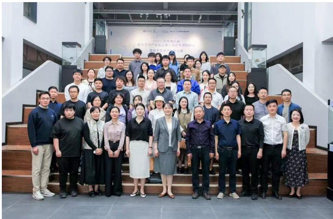
湖北高校数字艺术产业就业育人合作论坛

通过邀请韩国国民大学专家团来访、组织国际交流项目解读会等方式，围绕学科建设、科研合作与国际化人才培养展开深度交流，聚焦学校“申硕”核心任务，探讨高层次人才引进与国际化合作路径。依托韩国国民大学人工智能、数字媒体等全球排名前 100 的优势学科，为师生搭建国际化教育平台，支持学术深造与科研合作。并与专业研究生院联合培养项目合作开发本土非遗文化数字资产，以“虚拟明星 IP 孵化”为案例，推动产学研协同创新（如为韩国娱乐产业开发数字化解决方案的经验迁移）。拓展教师的国际视野，为引入国际先进课程体系与教学资源、开展国际科研合作奠定了基础。