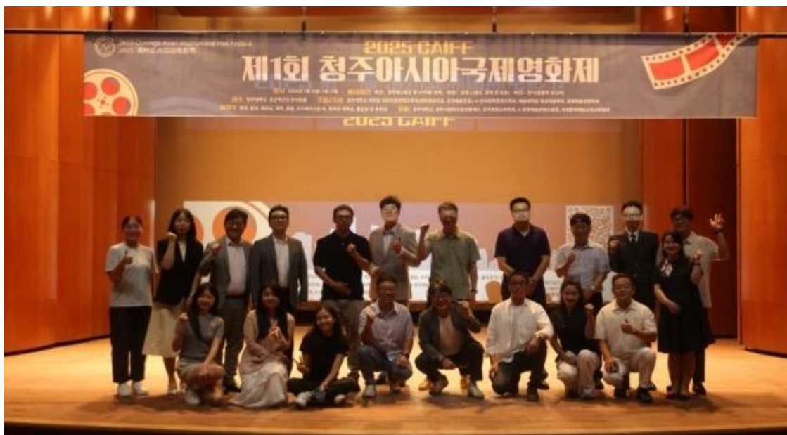
2025 清州亚洲国际电影节获奖代表及评委合影