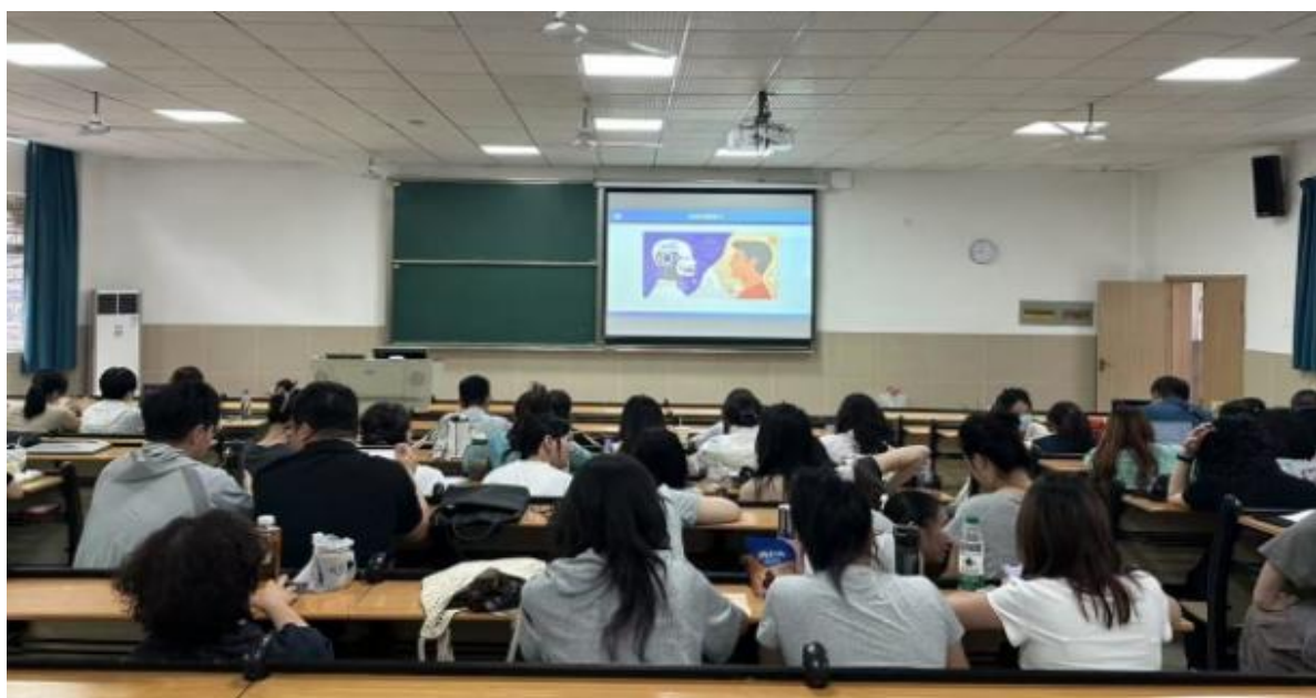
传艺学院教师分会场集中培训

制强化等；教师计划将所学应用于教学实践，以 OBE 理念为引领，推动课程重构、考核创新及技术赋能，目标为社会培养高素质艺术设计人才。深入探讨利用 AI 工具优化教学设计、丰富教学资源，旨在以数字技术重塑艺术教育模式。创新课堂教学管理以提升教学质量为核心，创新教学方法，通过强化“三率”（到课率、前排就座率、抬头率）管理，有效增强了学生课堂参与度与专注度，营造了优良的学风。学院组织教师代表参加“湖北高校数字艺术专业就业育人合作论坛”，与行业专家、企业代表深入交流，围绕“学科+产业”协同创新，对接企业用人需求，为学生提供就业岗位；探索人才培养与产业需求的匹配路径；展示高校数字艺术教学成果与创新实践案例。通过与行业专家、企业代表深入交流，教师团队对数字艺术产业发展趋势（如数字经济、文化数字化背景下的人才需求）和企业用人标准（如技术能力、实践经验、创新思维）有了更清晰的认识，为学院优化人才培养方案、深化产教融合提供了实践参考。