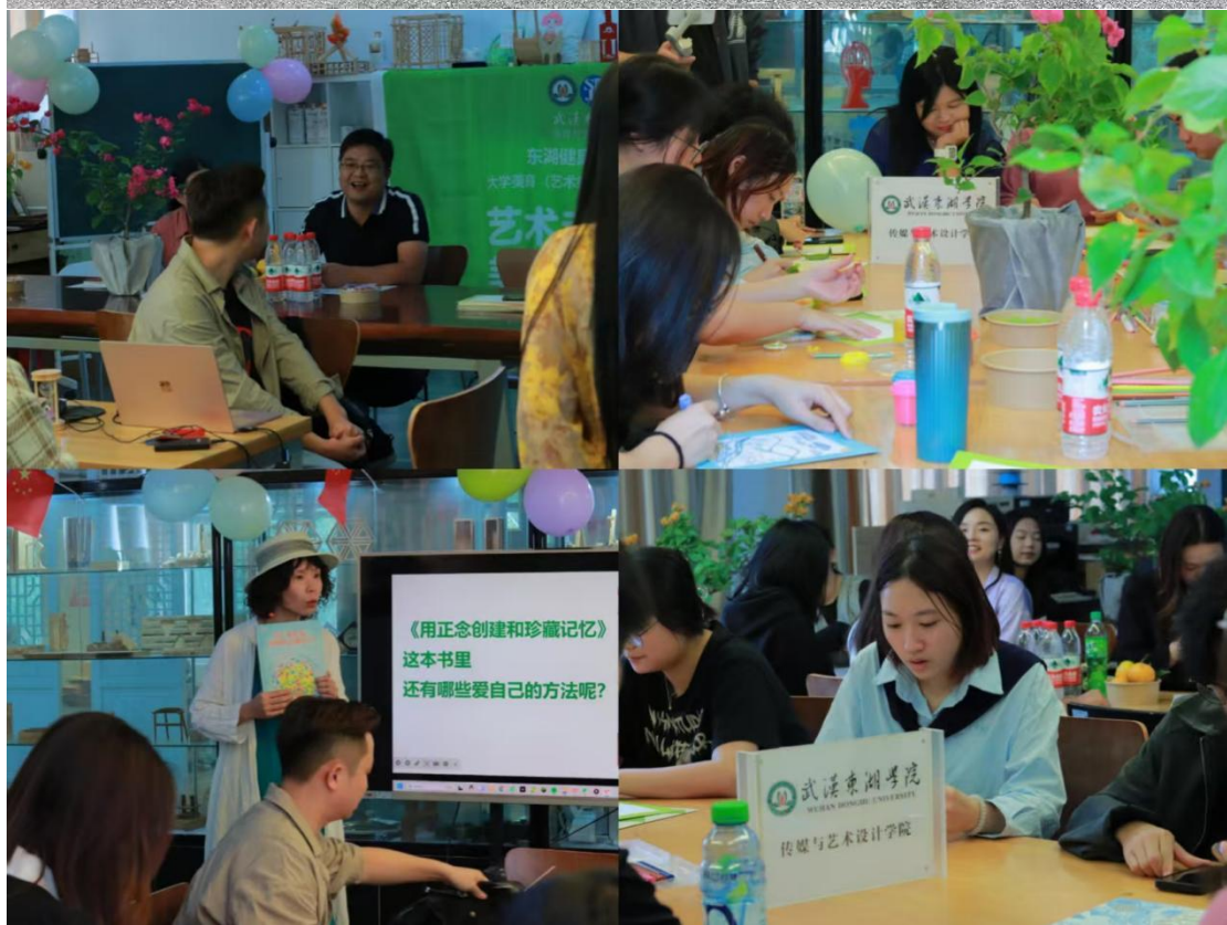
艺术疗愈正念疗法沙龙