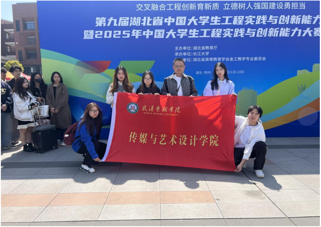
中国大学生工程实践与创新能力大赛传媒与艺术设计学院师生团队

具与表达方式，拓展了艺术边界，如《非遗韵事》用 Unity 引擎构建数字孪生模型，《机械迷城》通过 AI 优化工业设计，推动“艺术+技术”复合型人才培养，形成传统与现代交融、技术与艺术共生的创新格局。我院聚焦“数字经济赋能实体经济”主题，模拟智慧城市管理与工业生产线优化，实现从“技术开发”到“场景应用”的落地，将“艺术赋能”理念转化为实践。