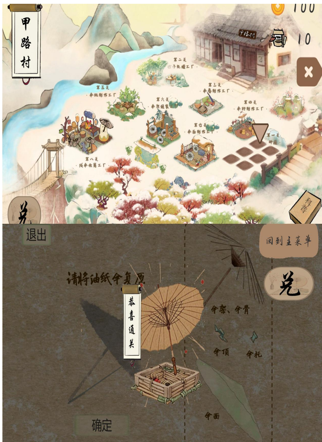
《非遗韵事——甲路油纸伞》