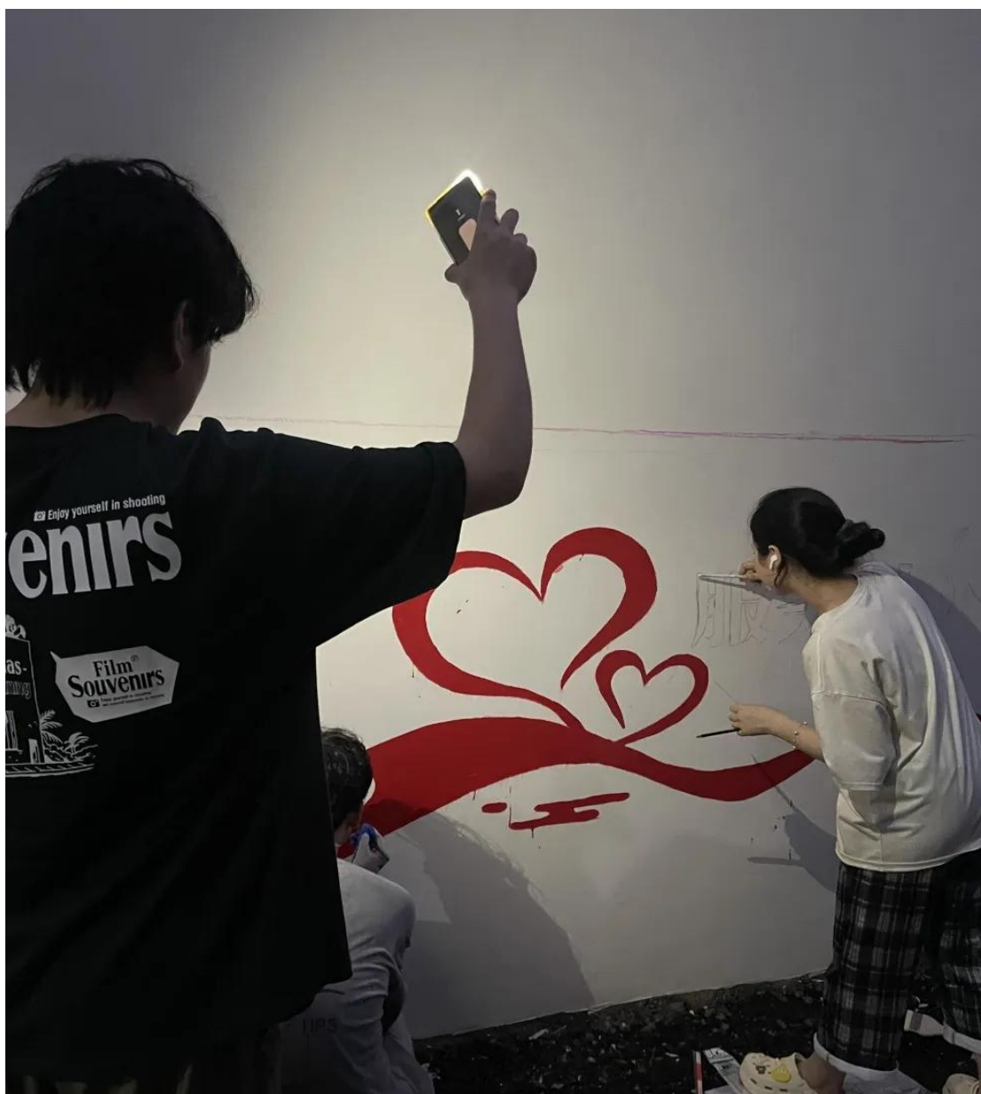
学生们不畏艰难 日夜奋战进行墙绘活动