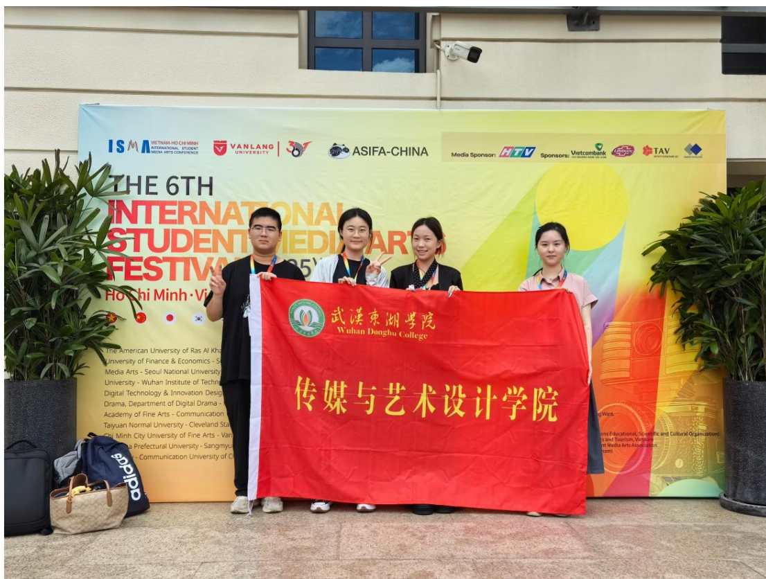
第六届国际学生媒体艺术节（2025 ISMA）活动现场师生合影