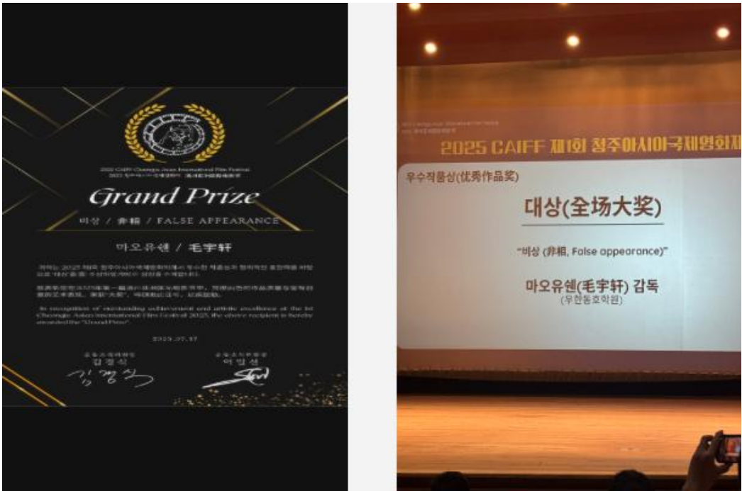
学院教师团队获奖证书