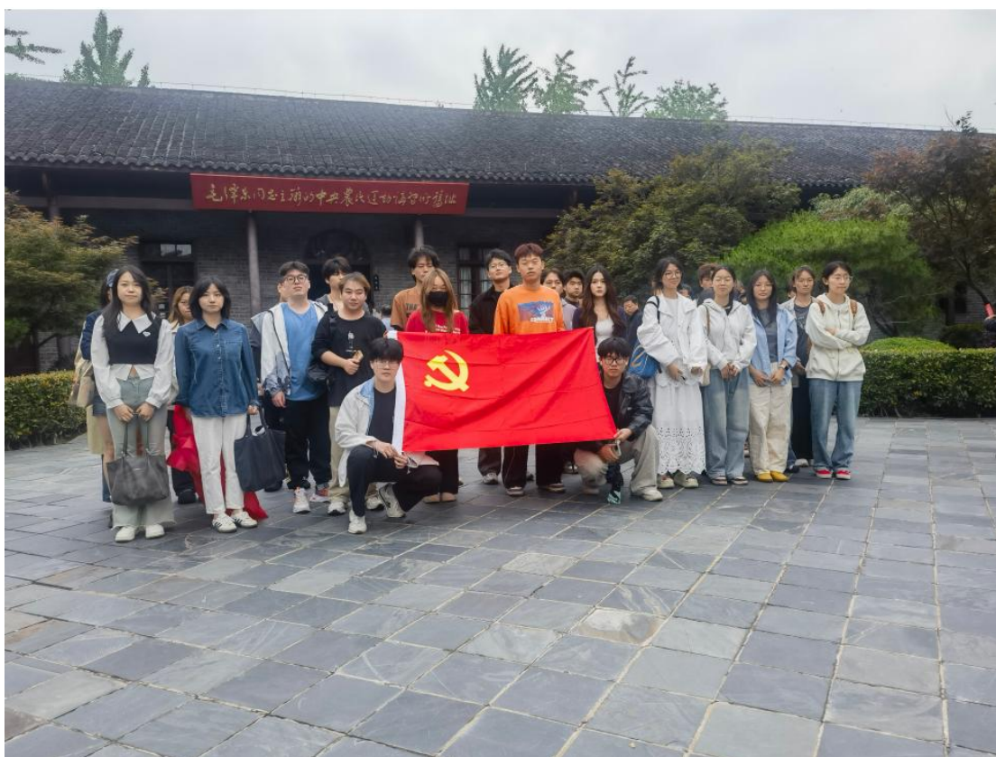
毛泽东旧居红色教育基地