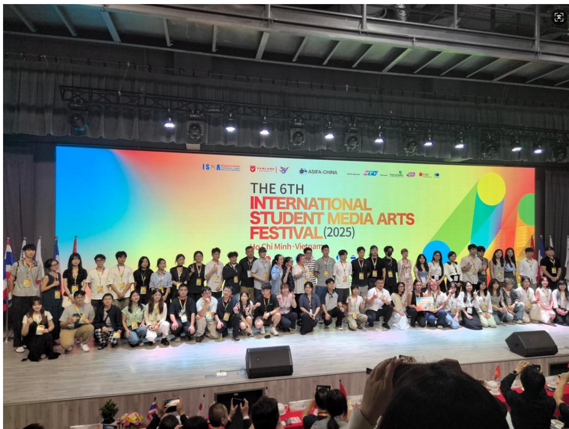
第六届国际学生媒体艺术节（2025 ISMA）开幕式教授合影