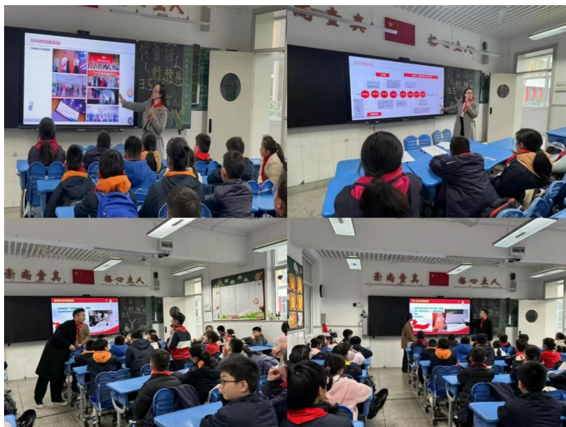
武汉东湖学院传媒与艺术设计学院与武汉小学五（5）班联合授课—雷锋题材红色经典作品

学院通过红色经典实践，引导学生在新时代背景下深入理解雷锋精神，传承红色基因，增强社会责任感和使命感。全方位、多角度地了解了雷锋的生平事迹和他所展现出的无私奉献、助人为乐的精神品质。红色经典作品不仅是传播雷锋精神的重要载体，更是思政教育的生动教材，让孩子们在艺术的熏陶中深刻感受到雷锋精神的魅力与价值。