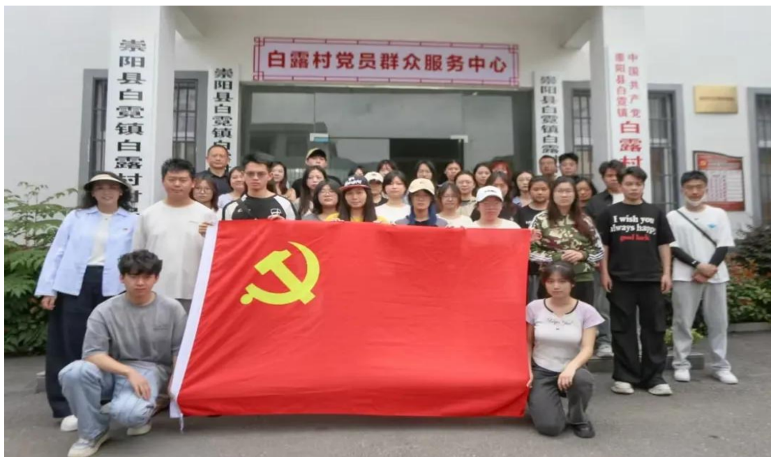
传媒与艺术设计学院党支部活动参与师生合影

实地完成“主题墙绘设计与传统文化传承”项目，将专业能力转化为服务乡村的实效，以白露村为“点”，辐射乡村振兴全局之“面”。白露村不仅是脱贫攻坚的见证地，更应是青年学子感知国情、锤炼本领的实践课堂。湖北省崇阳县白露村向学院赠送了一面印有“乡村振兴先锋，校村合作典范”字样的锦旗，以表达对学院在乡村振兴实践中所作出杰出贡献的诚挚谢意。