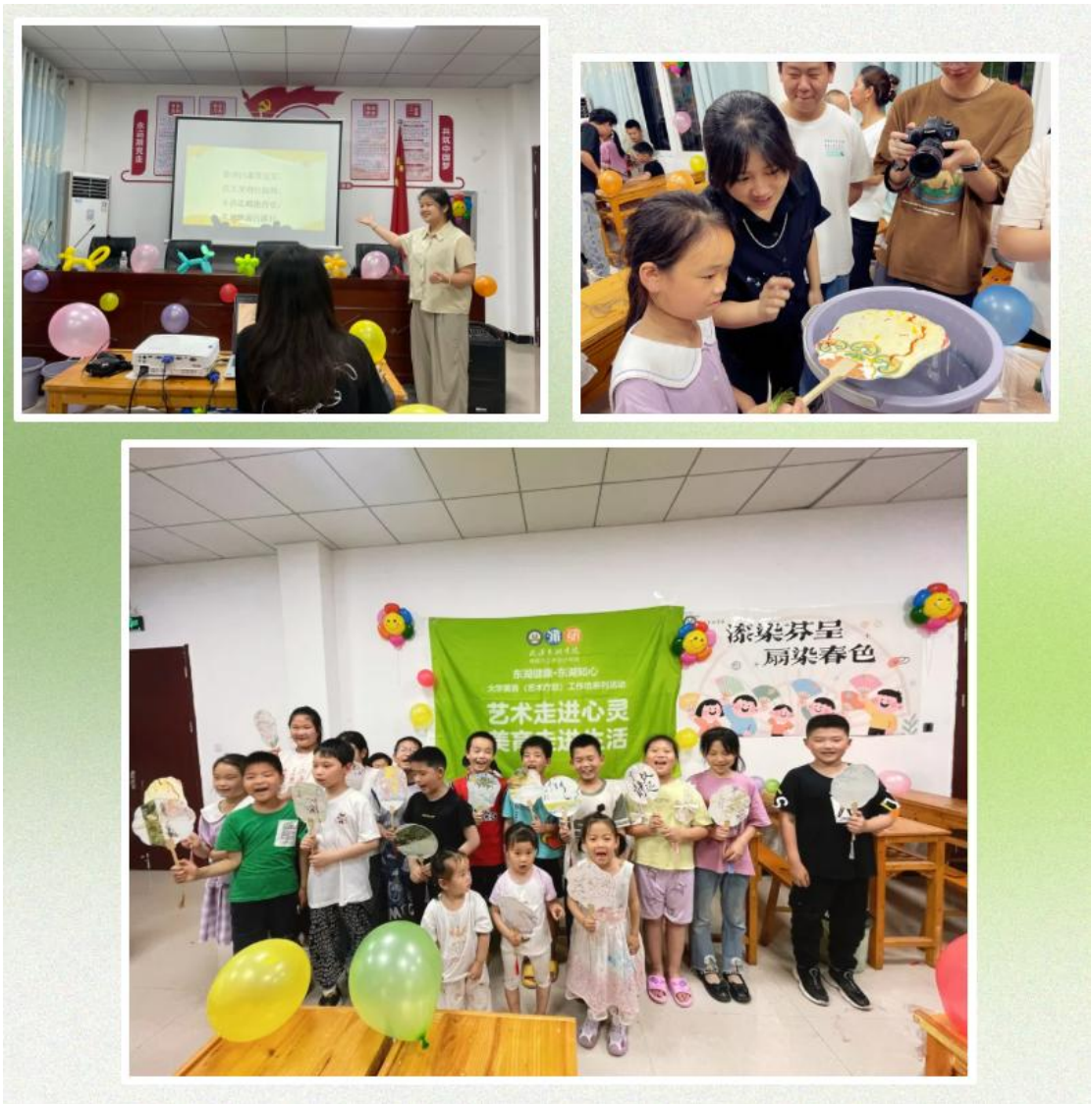
艺术疗愈活动合影