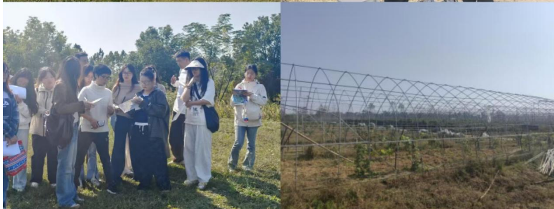
武汉东湖学院传媒与艺术设计学院师生项目实地调研及毕业设计选题活动