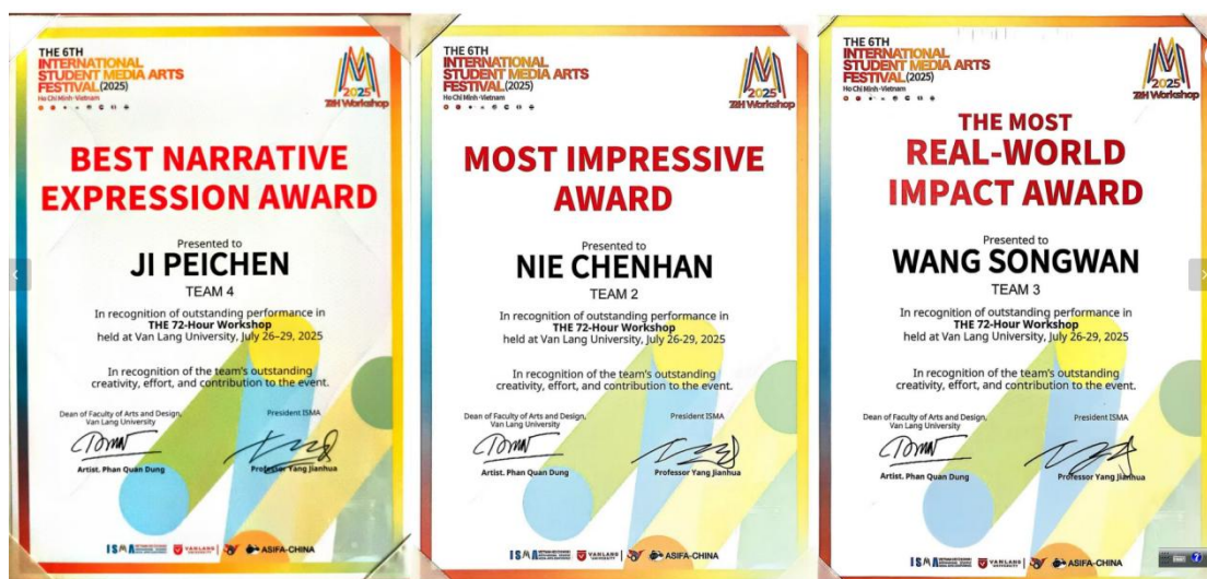
72 小时工作坊获奖证书