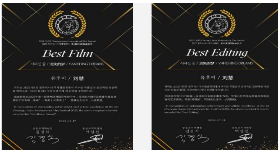
学院教师团队获奖证书