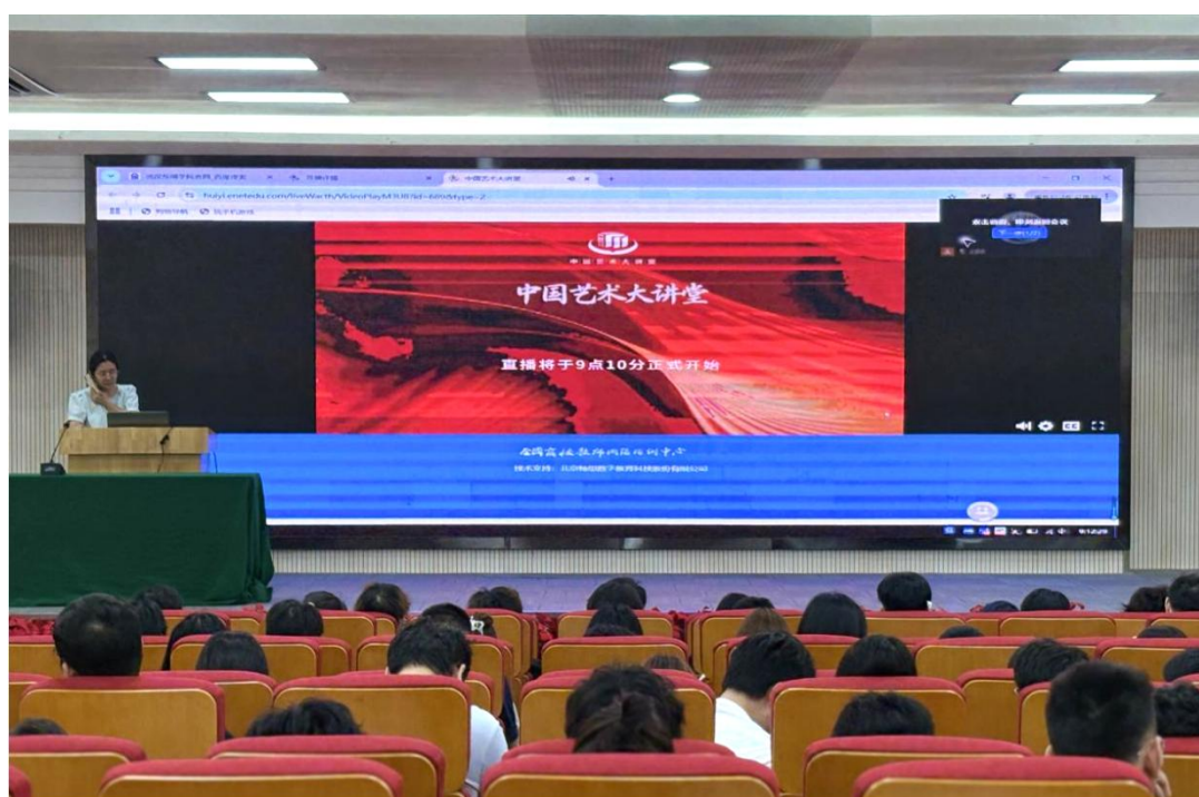
“中国艺术大讲坛第三讲”分会场

学院明确将“中华优秀传统文化”的传承与弘扬融入课程教学全过程。在“红色沃土·设计之源”“创意竞赛助推文旅与产教融合发展”、毕业设计创作等环