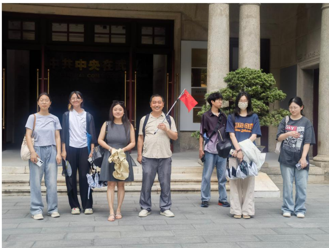
武汉中共中央机关旧址纪念馆