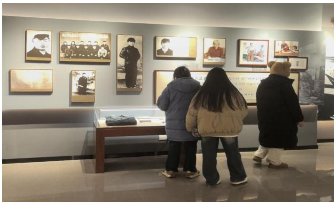
师生观摩雷锋遗物